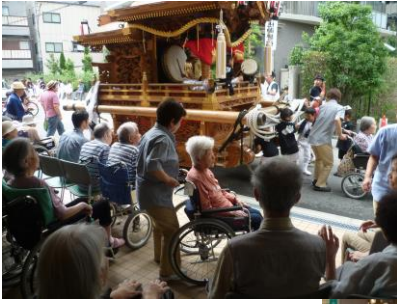
お～斜めになってる！

ハミングベル緑橋では、だんじりの接待場所となっており、飲み物の振る舞いをしています。その為、踊りや大阪締め、だんじり囃子をして盛り上げてくれます。