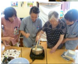
固まってきました！