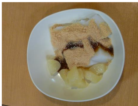
ひんやりおいしいわらびもち♪

と変化を口にされていきました。また「昔はよく作ったよ。」とご自宅で子供に作ったという方もおられました。最後に重くなったところを職員が必死！に混ぜ、冷やしてきな粉と黒蜜で完成です！ 少しやわらかめのわらびもちでしたが皆様「おいしい。」「懐かしい。」と喜ばれ、きれいに完食されていました。