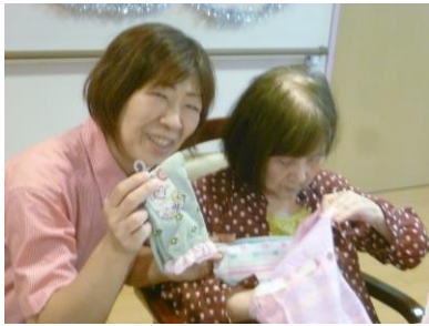
何が入っているのかな??

7月12日(火)は、2階入居者様のお誕生日でした！外出も考えていたのですが、当日はあいにくの雨。フロアでのお誕生日会となりました！ まずは、フロアの準備です！職員と一緒に、飾りつけをしました！「これ、どこに貼ったらいいかな」といいながら、皆を手伝ってくれました！ 席に座り、皆で手拍子をしながら、ハッピーバースデーと歌を歌いました！