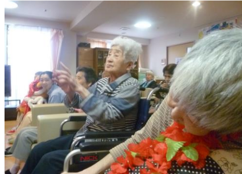
曲に合わせて、踊ります！

最後には、入居者様・利用者様も前に出て、ココナッツの方たちと手をつなぎ輪になって踊りました！踊りに合わせて、首からかけた色とりどりの花飾りも、ゆらゆら揺れます。その場が一体となり楽しい雰囲気の中終わりました。