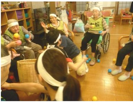
皆で、玉入れ頑張りました！