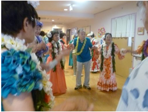
輪になってダンス！！

6月13日(月)、フラダンスボランティアの「ココナッツ」さんが来られました！カラフルな衣装姿を見て、皆様「綺麗ねえ」と笑顔。陽気な音楽にダンス！気分は南国に行ったかのようにです！ 前で踊っている姿を、皆様集中して見ておられました！音楽に合わせて、一緒に手を動かして踊ったり、手拍子をとったりと、楽しまれました！