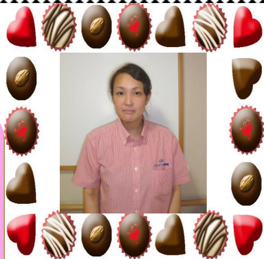
デイサービスにここに介護職