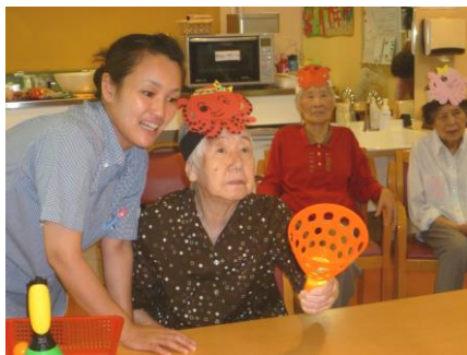
具材を狙って表情も真剣です!

そして午後からは中に入れる具材をかけてのピンポン飛ばしゲームに参加していただきました。具材の絵や写真が貼られた箱をめがけてピンポンを飛ばし、入った箱に貼られている具材を獲得できる、という