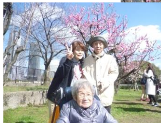
桃の花の前で記念撮影！！

がある様で初日と最後の日は咲いている桃の花の種類も違って行くと度に違う雰囲気が楽しめました。桃園に行った日はどの日も天候に恵まれ、皆様笑顔で思い思いに散歩を楽しまれました。桃の花を愛でておられました。