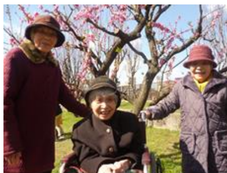
皆さんの笑顔もにこやかに咲いていました☆

まだ蕾の木もありましたが、ピンク色の可愛い桃の花を見ることが出来ました☆ 「わあ、きれいやね〜」と皆さん、笑顔いっぱい、春の訪れを喜ばれていました。