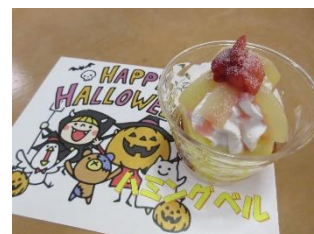
ハロウインのプリンアラモード