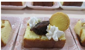
カステラにあんことホイップクリーム