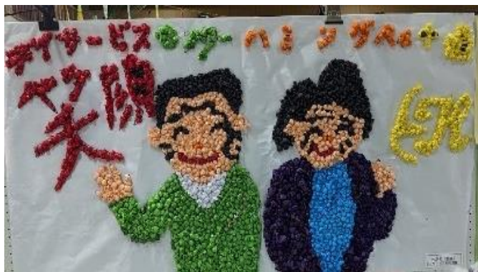
利用者がお花紙を丸めて、貼り付け一週間以上かけて作成した大型作品「笑顔」