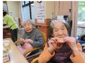
ミルクせんべいをかじってポーズ

くじ付きのチョコがあり、選んだ方は「ハズレやったわ」の声がほとんどでしたが、なんと3回も当たりを引いた方がいて、ご本人が一番驚いていましたー！！ 好評でしたので、今後も不定期で登場します！楽しみにしていてください。