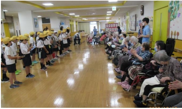
リコーダー演奏と歌を元気に披露

最後の見送りには握手やハイタッチをするふれあいの時間があり、普段見られないような笑顔で大変喜んでおられました。