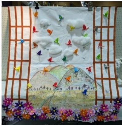
これも利用者とともに取り組んだ超大型作品「秋の風景」