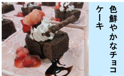
色鮮やかなチョコケーキ