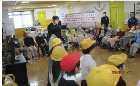
矢寺校長先生も来られあいさつされました。