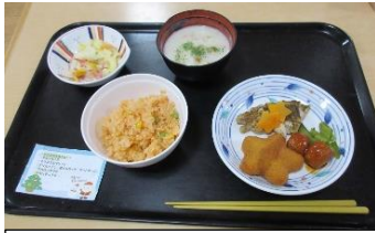
クリスマスメニューの昼食