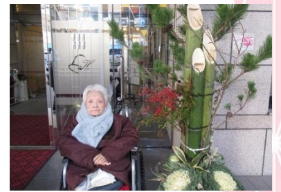
施設玄関前の門松の前で