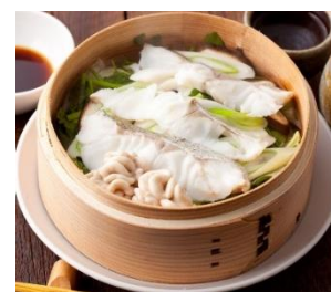
たらと白子と野菜蒸し

茹でるよりも水っぽくなく、にくくふつくらと仕上がりが、時間が経ってもパサつきにくいです。