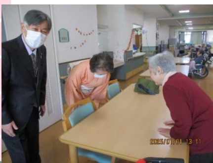
理事長と施設長がお一人お一人にあいさつに回りました。