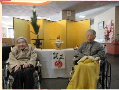
玄関ホールの正月飾り台の前で