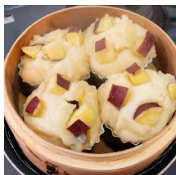
サツマイ入蒸しパン