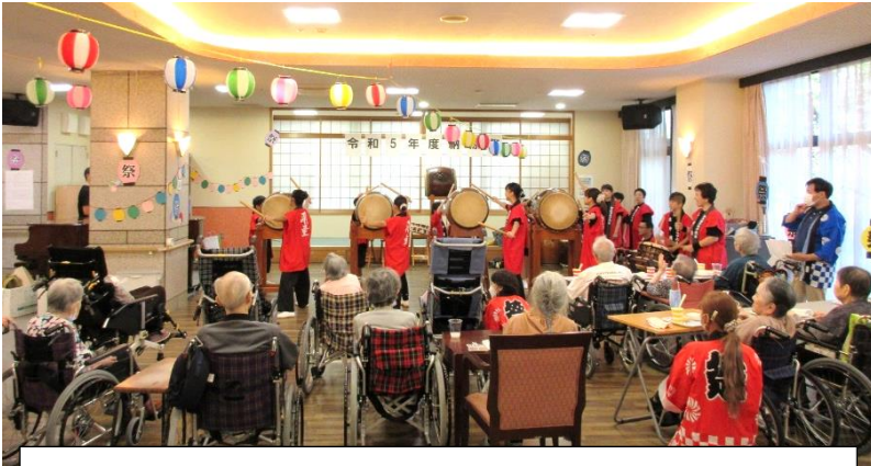
北中道和太鼓クラブ「飛童」による息の合った演奏