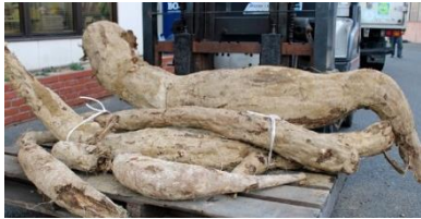
掘り出された葛の主根(根塊) グリーンモンスターと呼ばれ大量の栄養分から大繁殖する。