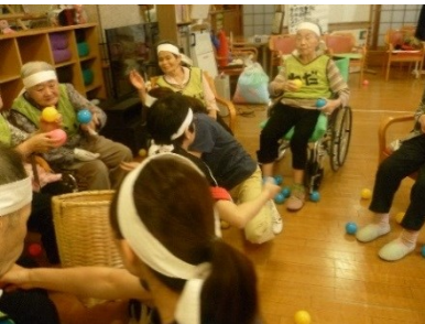
皆で、玉入れ頑張りました！

続いている仮装競争では男性が女性に、女性が男性に仮装しての競争でみなさん大爆笑！ 応援合戦では両組勝利のため、に気合いを入れて応援しました。