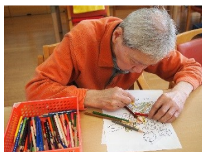
塗り絵は、ポップなものから繊細な絵柄まで