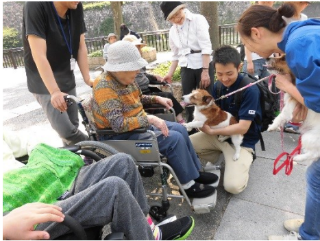
犬を散歩されている一般の方との交流がありました。

記念撮影をしましたが、日差しが強かったので木陰に入り緑道を進みました。また、虫が飛んでいたり見慣れない花が咲いているのを見て「あれ摘んで帰ろう」と利用者様は柔らかい表情をされていました。お城が見える堀に到着し、コースで乾杯！風を感じながらゆっくりと風景を眺められる方や、鯉や亀の餌やりに必死な方もおられ、ゆったりとした時間を過ごせました。