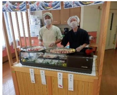
華やかなパーティー料理 は寿司屋台を含め、日清 医療食品(株)のご協力 で彩られました