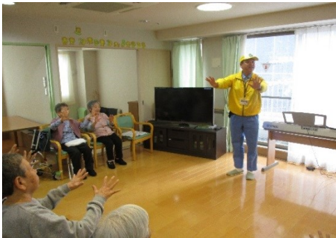
皆で楽しく指の運動

5月9日(月)東成区役所から、あんぱト(安全パトロール)さんが、ハミングベル緑橋に訪問にられました。日頃の活動やメンバーの紹介をして頂いた後は、手や指を使った体操を、利用者様にユーモアを交えて、楽しく指導して頂きました。その後は、利用者様や職員も一緒に、輪投げ大会を行いました。皆さん上手に輪っかを投げておられ、賞品のポケットティッシュをゲットされていました。