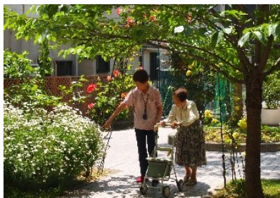
中庭散策で季節を感じる。

皆さんの多才なご様子に、我々職員も「若者も負けてはおられないわ！」と触発される日々です。笑顔や明るい歌声があふれる空間が、皆さんの心と体の栄養となりますように。