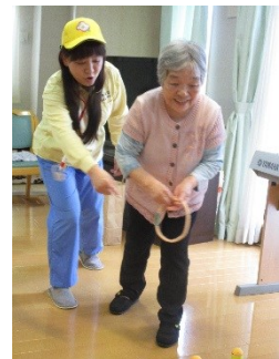
輪投げも盛り上がりました！