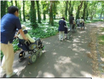
木陰に入ると「自然のクーラーやわ」との声が

5月の行事として大阪城公園まで遠足を企画しました。初日の10日はあいにくの雨で中止となりましたが、他の日は天候に恵まれました。施設を出発し中央大通り沿いに車椅子を押してゆっくりと進みます。皆様日頃は見ることのない、たくさん車の往來を「やあ賑やかやなあ」と目を丸くして眺めておられました。10分程で公園に着き、まず入り口で