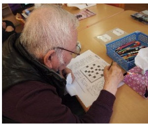
クロスワードや計算問題に挑戦中！

皆さんで力を合わせて行うレクリエーション！も良いですが、デイサービスでは各々の方が没頭できる趣味の時間やいきいきと笑顔で過ごせる余暇の時間も大切にしています。