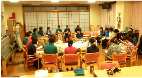
講師の特養介護主任を囲むようにして始まりました。

強会が開催されました。実演のあとは職員同士で手順を確認しながら復習をし、検証、意見を交わし合い、有意義な時間が過ぎていきます。