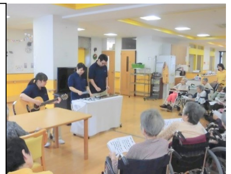
ギター、トーンチ ヤイム、木琴のト リオ演奏 「カタツムリ」「夕 焼けこやけ」「ふる さと」の3曲を演 奏しました。

この日は利用者様へ日 ごろの感謝を伝えると言 う意味をこめて、新人職員 から楽器演奏のプレゼン トと、おやつバイキングを 楽しんで頂きました。