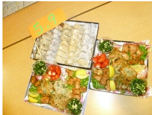
全部を詰めて無事完成！！

シートを敷いてきれいに盛り付けました。見た目も華やかで利用者様の箸も進み、皆さん口々に「おいしいわ。」と話され唐揚げやチヂミも、どんどんなくなっていきました。 楽しい雰囲気の中、行事は終わりましたが、今度同じように外で食事をする機会には是非良い天気の中なかで食べられるといいですね。