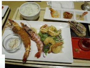
海老料理を堪能され ビールも ↑

「えびが食べたい!」との本人の希望で行われた奏でる日。当日は息子様も一緒に、梅田グランフロントの「海老れんこん」にえび料理を食べに行きました。