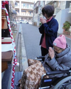
特養棟のすぐ西にある 火除大明神へ