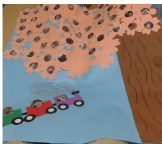
4階 《咲かせよう笑顔の花》