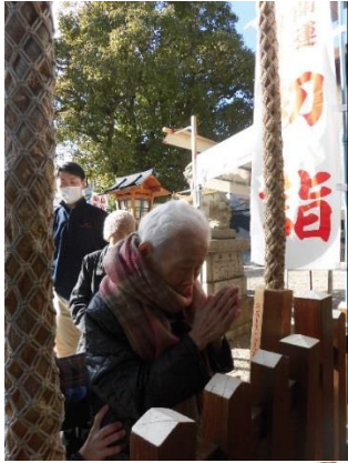
この地区の産土(うぶすな)神社 八阪神社へ初詣