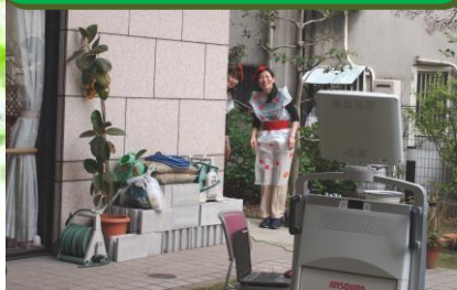
舞台袖で出番待ち。 ドキドキです！

ハミングベル中道の中庭にある桜の木が、今年もきれいな花を咲かせてくれました。平成20年、家族会発足の記念に植樹された桜の木。利用者様とともに、成長を見守ってきました。年々立派になっていくその姿に、子どもの成長を見守るようで、心が和みますね。今年のデイサービス花見行事は、そんな桜の下で宴会をしました。職員による「かくし芸」で大笑いしたあとは、抹茶を点てて、桜ようかんに舌つつみ。目で、耳で、舌で、肌で。春を感じていただきました！