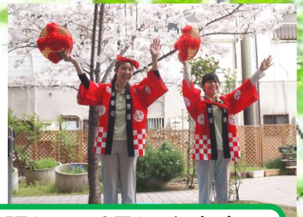
歌に踊り、手品に人文字、 モノマネまで。何でもござれ!!