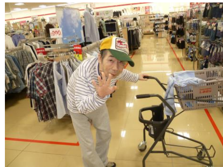
いっぱい、買いました！

今は衣替えの季節ですので、午後からは新しい洋服を買いに行くため近くに新しく出来たファッションセンターしまむらに行ってきました。店に入ると気に行った服があればカゴに入れて色々買われない様子。その中から厳選し、一番似合いそうな服を選び購入しました。帰りの車内でも買った服の話で盛り上がりました。 とても充実した日曜日で入居者様、職員とても満足した一日でした。またこんな日をごしたいですね！