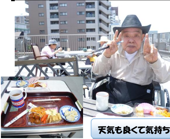
天気も良くて気持ちいい

5月22日、日曜日。グループホームでは昼食にお弁当メニューを作り屋上で昼食を食べました。準備の段階から盛り付けを手伝ってもらいとてもおいしそうなお弁当の出来上がりです！ 綺麗な青空の下で食べるお弁当は本当においしく入居者みなさんも笑顔が溢れていました。外で食べる事が久々で暑さも忘れて完食されていきました。