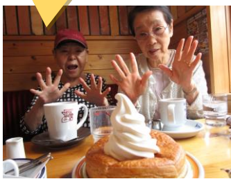
大きくてびっくり！

ワイと楽しい雰囲気でも頂きました。食べ終わられた後も「美味しかった！また来たいなあ」「やっぱり皆で食べると楽しいし、おいしいね」「次はどこいこうか」と帰られる前まで笑顔でお話されていました。