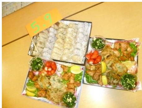
全部を詰めて無事完成！！

ボックスにシートを敷いてきれいに盛り付けました。見た目も華やかで利用者様の箸も進み、皆さん口々に「おいしいわ。」と話され唐揚げやチヂミも、どんどんなくなっていきました。楽しい雰囲気の中行事は終わりましたが、今度同じように外で食事をする機会には是非晴れてお外で食べられるといいですね。