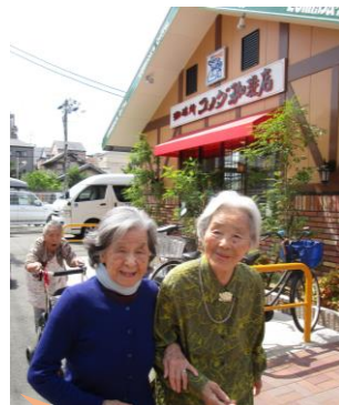
美味しいコーヒーやジュース 皆さん大満足です！！