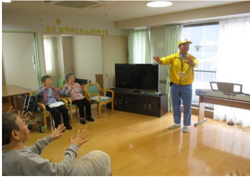
皆で楽しく指の運動

日頃の活動やメンバーの紹介をして頂いた後は、手や指を使った体操を、利用者様にユーモアを交えて、楽しく指導して頂きました。その後は、利用者様や職員も一緒に、輪投げ大会を行いました。皆さん上手に輪っかを投げておられ、賞品のポケット