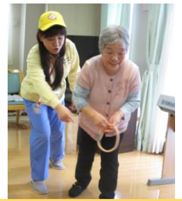
輪投げも盛り上がりました！