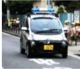
この車を見たらお気軽に声をかけて下さい。

黄色いジャンパーを着用され、青色パトカーに乗って、毎日区内を巡回したり防犯の啓発活動などを行い、子供たちや地域の住民の安全対策業務に活躍されている、あんぱとさん。皆さん、もし防犯上で気になったり、不安な事があれば、お気軽に声をかけていただき、ご相談ください。