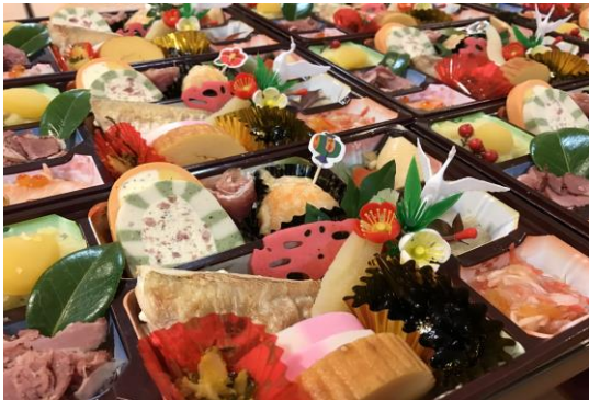
↑元旦にハミングベル緑橋で提供したおせちです。職員で分担して頑張って作りました！

☆紅白蒲鉾…紅白は祝いの色。蒲鉾は「日の出」をあらわし、元旦を象徴する料理。紅はめでたさと慶びを、白は神聖を表します。☆栗きんとん…豊かさや勝負運を願って。黄金色に輝く財宝に例えて豊かな1年を願う料理。☆黒豆煮…元気に働けます様に。まめは丈夫・健康を意味します。まめに働くにも掛けられています。☆昆布…喜ぶに掛けた一家発展の縁起物です。☆海老…長い髭を生やして腰が曲がるまで長生き出来る様願った長寿の象徴です。