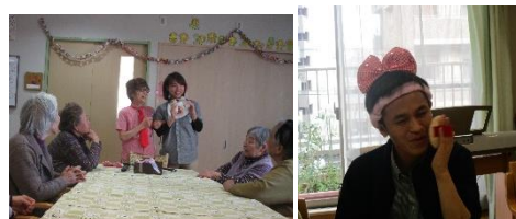
職員も変装グッズでなりきりました！

午後からは利用者の方も職員も、なりきり〇〇と称して職員が持ってきた赤ちゃんやサラリーマン等の変身グッズを身につけて、今年一年の振り返りと来年の抱負をひと言づつ頂きました。今年について「良い一年だったよ」と仰る方が多く、皆さん元気に一年を終えることを職員一同嬉しく思います。今年も楽しいことしましうね☆