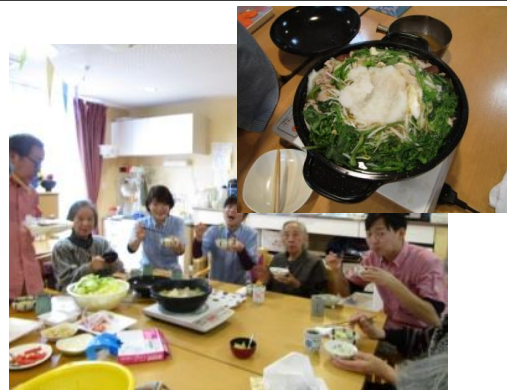
お鍋をみんなで囲みわいわいと食べました

すると「ほんと？一口は食べないかな。」とさつきまでお腹いっぱいと言っていた方も、うどんは別腹？の様子でした。かりとすすって食べておられました。最初は部屋も暖房を入れていましたが、食べるにつれて温まり、利用者様も職員も頬を赤らめて団らんの楽しい時間を過ごす事ができました。