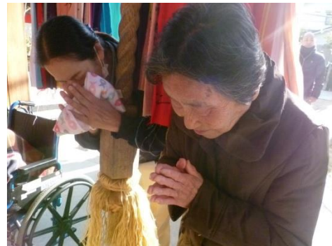
良い一年になりますように！

新年明けましておめでとうございませう。グループホーム「音々」は1月1日、2日と白山神社に初詣に行つて来ませう。今年のお正月は暖かく、寒さを気にする事なく、初詣に行くことができるとてもよかつたです！