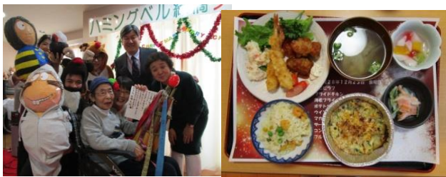
アート展の表彰式も行いませう。