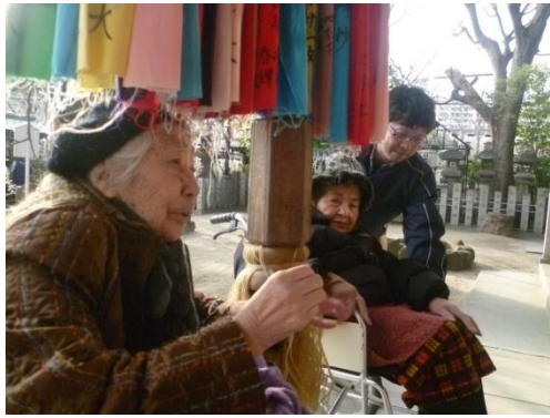
今年一年の、健康祈願！

新年明けましておめでとうございませう。グループホーム「音々」は1月1日、2日と白山神社に初詣に行つて来ませう。今年のお正月は暖かく、寒さを気にする事なく、初詣に行くことができるとてもよかつたです！