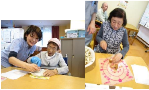
みんなで下ごしらえもしました！！

忘年会は毎年の恒例行事で利用者様と一緒にお昼ご飯に鍋を囲み、ゆつくりとお話をしながら温かい物を頂くと心も体もぽかぽかになります。利用者様もいつもより箸が進み、「お腹いっぱいや。」と言っておられても職員が「メのうどんがありますよ。」と声をお掛け