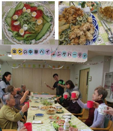
今年一年にみんなで乾杯！！

12月21日に楽々では忘年会を行ないました。今年は中華バイキングパーティです。職員が腕によりをかけて作られた料理はテーブルいっぱい並べられ、どれも美味しそう！皆さん片手にジュースをもって「乾杯！」の声とドーンと鐘の音を鳴らすと共に賑やかな宴の始まりです。お好きな料理をお皿に取り、お腹いっぱいになるまで料理を楽しめました。