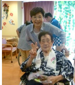
浴衣がお似合いです！