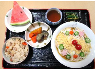
七タそうめん(具材は星型) 具沢山中華おこわ 三種の炊き合わせ、漬物 スイカデザート

毎月1回(今月は2回)昼食時に 行事食として、ちよっと豪華な食事を職 員がデザインしたランチョンマットで 召し上がって頂いています。