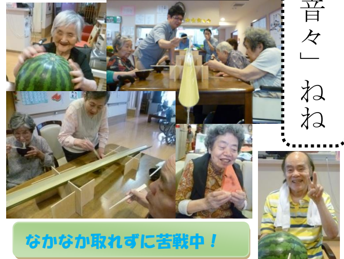
なかなか取れずに苦戦中！

くておいしいわ〜」と、とても喜 ばれていました。 流しそうめんでは、目の前で流 れていくそうめんには、皆様必死で す。「あー、行っちゃった」「次き たわ」と声をかけ合い、そうめん を取ろうと手を伸ばします！ 最初は、なかなかうまく取れな かったそうめんも、コツをつかん だのか、途中から取れるようにな っていきました。 スイカに流しそうめんと大忙 しな日でしたが、皆様お腹いっぱ い食べられ、大満足でした！ また、来年もしましょうね！