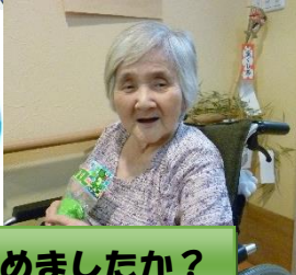
屋台は楽しめましたか？