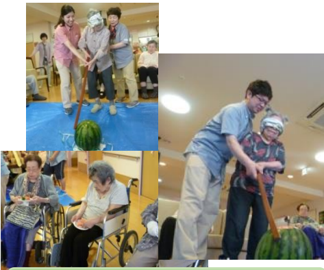
スイカが冷えてて美味しい！

しかし、スイカは当たっても、 なかなか割れません。「当たっ た！」「おいしい！」と回数を重ね て挑戦しました。その結果、見 事スイカは割れました！自分で で割ったスイカを頬張ると、「甘