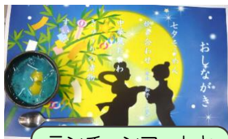
ランチョンマットと おやつ“夜空と星 の七タゼリー”