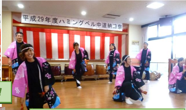
カッコいいよさこい踊りでした