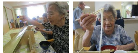
流し素麺楽しかったですね!

また、20日(日)にはそうめん流しを行ないました。長い竹をテーブルにセットし、利用者の方達がお椀を持って竹の周りを囲むと、いつでもそうめんをキャッチする準備万端です。皆様「こんなの初めてやわ」と仰られる方も多く、流れてくるそうめんをすくうのに一苦労しておられますが、コップを掴むと、下に落ちる前までに殆どすくっておられました。「もつと流して〜」「次私とるわ」とそうめんのリクエストが沢山! 「こんなんして食べるのもいつもより食べてしまいうな」とお腹いっぱいまで流しそうめんを楽しまれていました。