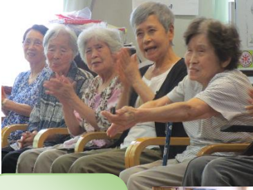
発表が終わると、この拍手♪この笑顔♪

発表中は一生懸命な子ども達の姿を、皆真剣に見つめ、暗唱で、時に詰まってしまう子どもさんがいれば、「頑張れ〜」の応援の声が起こり、発表が終わると温かい拍手が贈られていました。