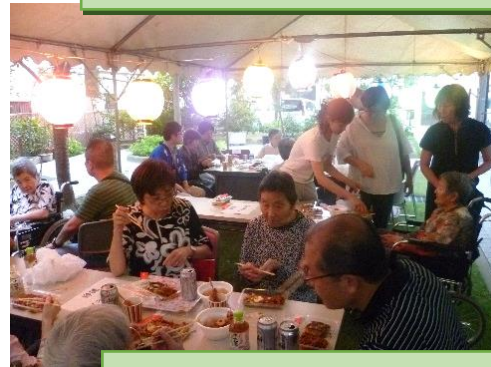
皆で屋台ご飯おいしかったですね！