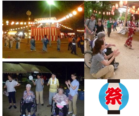
盆踊りでみんな楽しそう!!

ありマッサージを受けてみなさん喜ばれていました。夕方には東小橋公園での盆踊りに参加しました。屋台がたくさんあり、からあげ、焼きそば、フランクフルトを食べながら祭りを楽しみました。暑さを忘れて踊りを楽しみました!