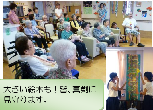
大きい絵本も！皆、真剣に見守ります。

2フロアで2公演の最後は、子ども達が順に席を回り、1人ずつの握手会です。子ども達からのお礼の言葉に、「頑張つてや」「上手やったで」と声を掛け、しっかりと手を握りしめておられました。