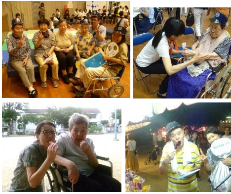
屋台の食べ物おいしい!

8月5日の昼、夕方と8月19日の3回に分けてグループホームは地域の夏祭りに参加しました。5日の昼には東成区民センターにて行われた祭りに参加しました。室内で行われていた為、涼しく快適に楽しむことができました。入り口で大阪地下鉄のイベントがあり、車掌さん風の帽子を配っていたのでみんな被って写真も撮りました。無料のハンドマッサージコーナーが