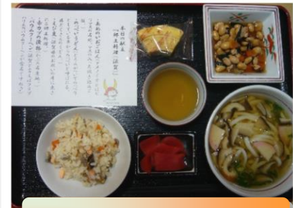
前は滋賀県でした

自身に縁のある県や出身地の回になると、特に楽しみにされる方が多く「子供の頃はよく食べていたのよ。」「お母さんが作ってくれていたのを思い出すわ。」と話されています。皆さん、食べ終わると口々に「美味しかったです。」「珍しい料理が食べられてよかったです。」と仰って下さっています。残り9道府県。それが終われば、次は世界1周をまわるかも・・・