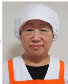
— 厨房 — 調理担当

趣味：縫製(皮製品) 好きな食物：お魚 (煮魚,特にカレー) 行きたい所：孫とUSJ 皆さんに一言：全く未経験で未熟な私ですが、皆さんの協力とご指導を頂き、真摯な姿勢で頑張ります。今後ともよろしくお祈いします。