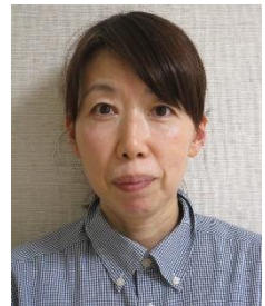
-グループホーム- 介護職員

趣味：「手作り市」に行く事 ミシンで小物づくり 好きな食物：チーズ 行きたい所：九州 (行った事がないので) 皆さんにひと言：歳を重ね覚えるまで何度も確認すると思いますが、よろしくお祈いします。