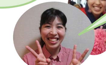
グループホーム介護職