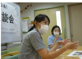
思い出の写真と共に話を進めます