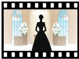
ウエディング写真館

ドレスを着ると目をキラキラさせて本当に嬉しそうにモデルさんに変身です。「笑ってください」とのカメラマンのリクエストに応えられます。また鏡で自分をご覧になっても笑顔です。周りで見学されている方も「奇麗やね！」と拍手をされました。ドレスを脱いだ後も「私、おかしくなかった？」「きれいに映ってる？」と気にされ写真をお見せするにつこりと頷いておられました。