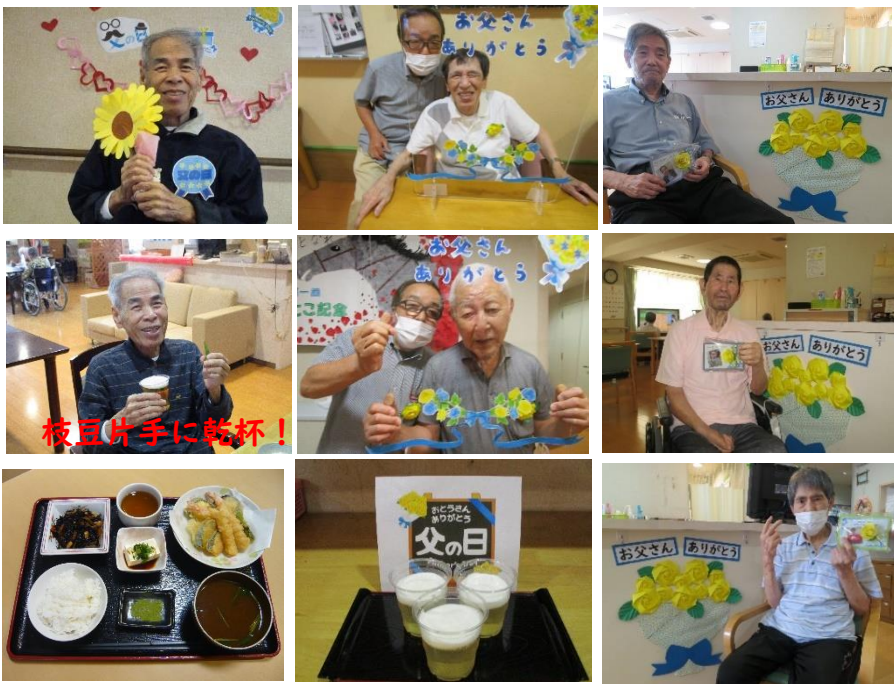
デザートは、リンゴジュースとマシュマロで作りました！

6月19日は父の日。各フロアで、男性のご利用者様・入居者様を中心に、日頃の感謝の思いを伝えるイベントを行いました。父の日のシンボルカラーである黄色のお花と共に記念撮影を行った。昼食時にはノンアルコールビールと塩ゆでした枝豆で乾杯！又、おやつ時には、職員手作りの生ビールのように見えるデザートでお祝いをさせて頂きました。