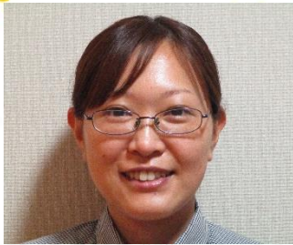
ヘルパーステーション