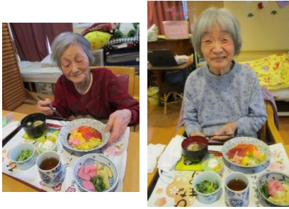
豪華で色とりどり