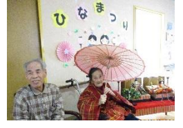
おやつ美味しそう