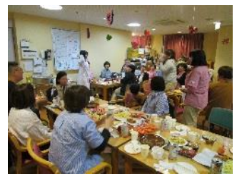
前回(平成31年3月)の様子です