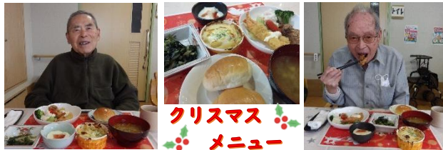
クリスマスメニュー

朝から「今日は何をするのかな？」と皆様わくわくされている様子。昼食の「クリスマスメニュー」をご覧になり「馳走やね！」「美味しいわ！」「味も良いし大満足やわ！」と皆様笑顔でいつもより箸が進みます。