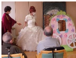
魔法使いが現れて ビビデバビデブー！