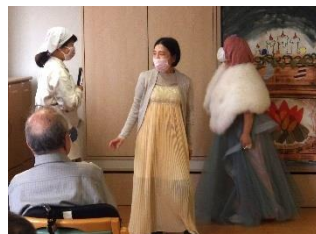
継母、義姉にいじめられて