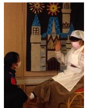
ガラスの靴がピッタリ