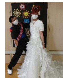
めでたしめでたし