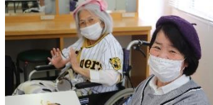
控室でも余裕の笑顔

2曲目、3曲目の「花は咲く」「ふるさと」は手話も交えて演奏しました。会場の皆さんも見よう見まねで一緒に手話をして下さる方もおり、一体感を感じられました。ステージ発表になりました。