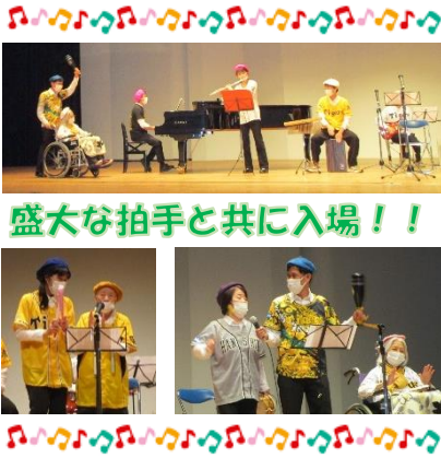
盛大な拍手と共に入場！！

♪タン・タタ・タン・タタ・タタ・タン・タンと「六甲おろし」の前奏と共に利用者様と職員が舞台に現れると会場が一気に盛り上がりました。