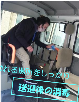
触れる場所をしっかりと 送迎後の消毒