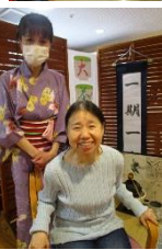
結構なお点前でした。