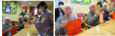
皆さん、真剣な眼差し